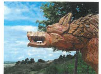
LA BÊTE DU GÉVAUDAN