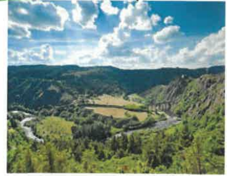
LES GORGES DE L'ALLIER

Départ du groupe après le petit-déjeuner, muni d'un panier repas pour le déjeuner.