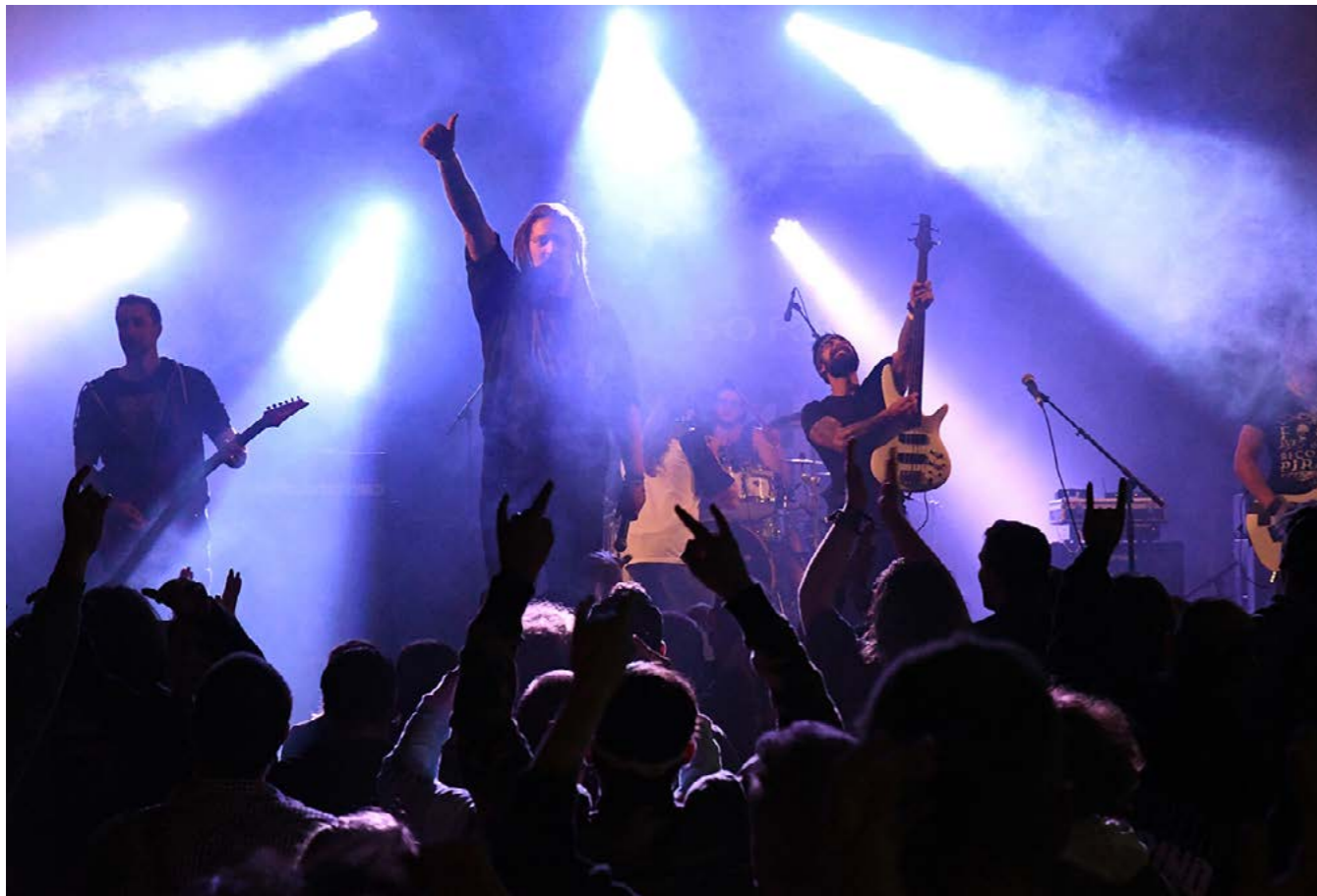
> Snap Border, Rock'N Bock 2018