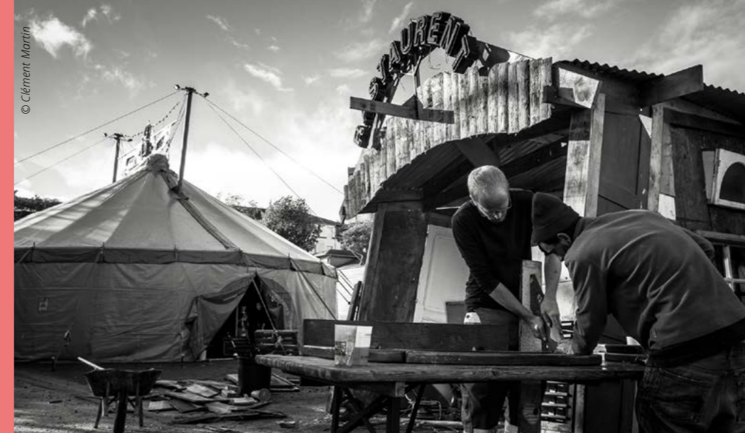
> Festival Michtô, site du Memô