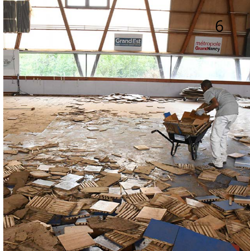
> Rénovation du sol, complexe sportif Marie Marvingt

La pause estivale est souvent synonyme de travaux pour les services de la ville qui en profitent pour faire les travaux nécessaires dans les écoles. C'est également le début de gros travaux comme la réfection de la toiture et du sol du complexe sportif Marie Marvingt et le démarrage de la construction de la structure multi accueil à Champ-le-Bœuf.