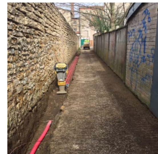
RUELLE DES VIGROUX, AVANT - APRÈS