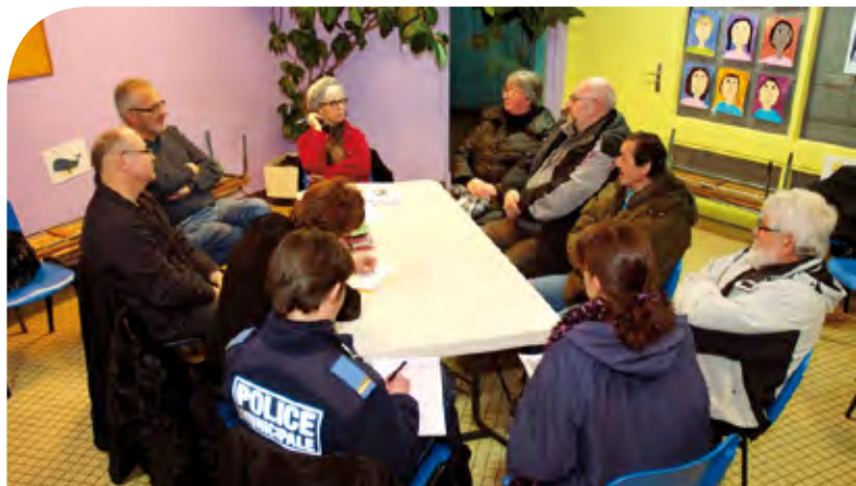
La question des transports au cœur des discussions lors de l'atelier rue Henry Brun le 5 février dernier.

Les comptes-rendus des ateliers sont en ligne rubrique participation citoyenne sur www.mairie-maxeville.fr . Pour toute suggestion et remarque, une seule et même adresse : participation@mairie-maxeville.fr