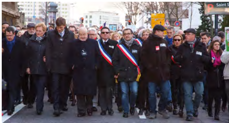
Marche pour la liberté d'expression du 11 janvier 2015

Maire Vice-Président de la Région Lorraine