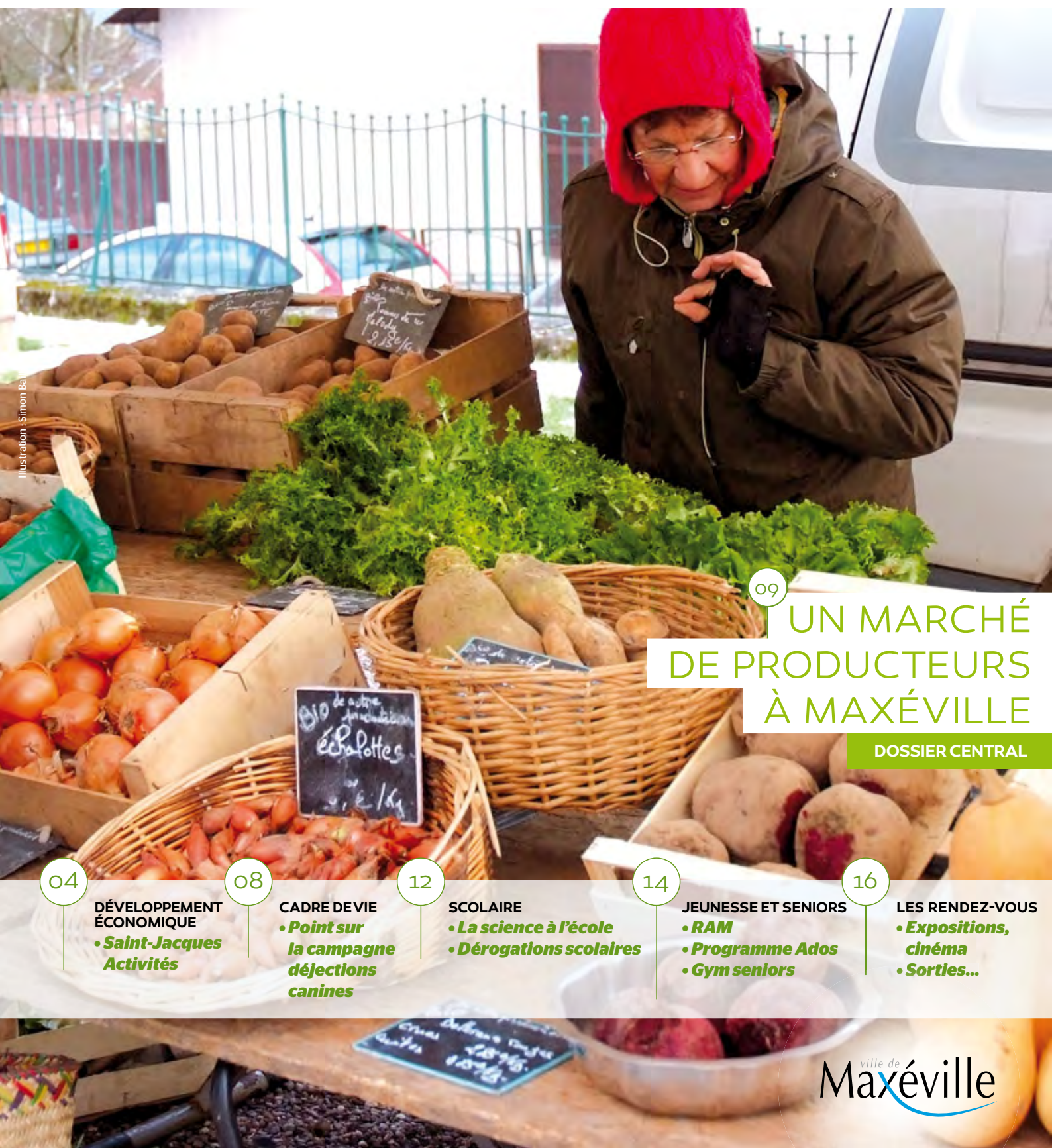
Illustration - Simon Ba

L'ACTUALITÉ DE LA VILLE DE MAXÉVILLE BIMESTRIEL | MARS - AVRIL 2015