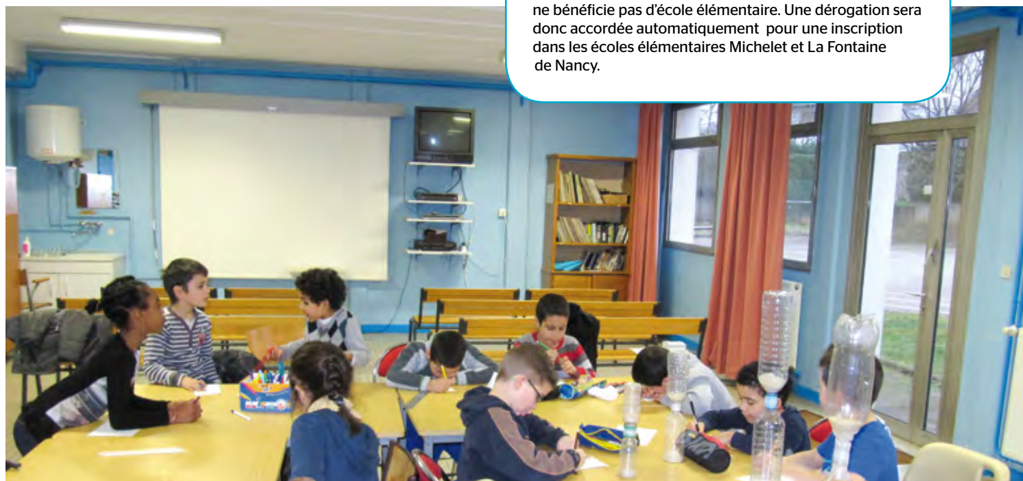
A la maison pour la Science, puis en classe dans le cadre des NAP

2 - Quartier des Aulnes - Plateau de Haye : Ce quartier ne bénéficie pas d'école élémentaire. Une dérogation sera donc accordée automatiquement pour une inscription dans les écoles élémentaires Michelet et La Fontaine de Nancy.