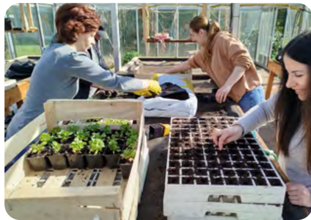
Le Lopin de Léo - Parc Léo Lagrange (16, rue de l'Orne) lopindeléo.maxeville@gmail.com