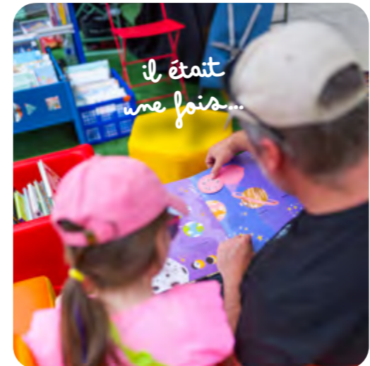
33 rue des Brasseries - 03 54 40 34 73 mediatheque@mairie-maxeville.fr